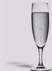
12,5 cl de champagne à 12°