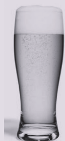
25 cl de bière à 5°