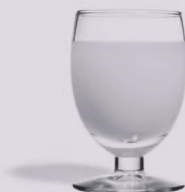
2,5 cl de pastis à 45°