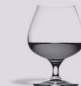
4 cl de digestif à 40°