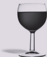
12,5 cl de vin à 12°