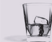
4 cl de whisky à 40°